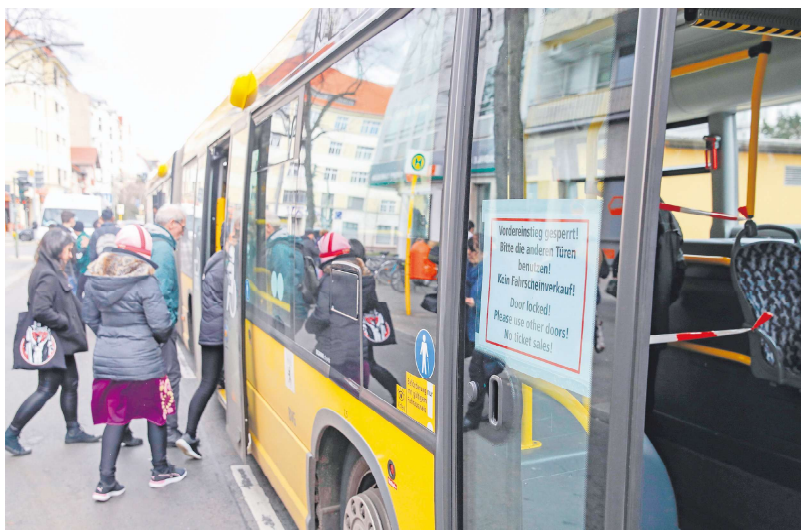
公交车司机中近44%为婴儿潮一代人。

德国经济研究所(IW)的数据表明，未来12年中将要退休的婴儿潮一代有1950万人，而即将步入社会的年轻人将只有1250万。这一发展趋势对于经济发展造成的负面影响不容小觑，社会老龄化仍是德国面临的核心社会政治挑战。IW研究员舍费尔