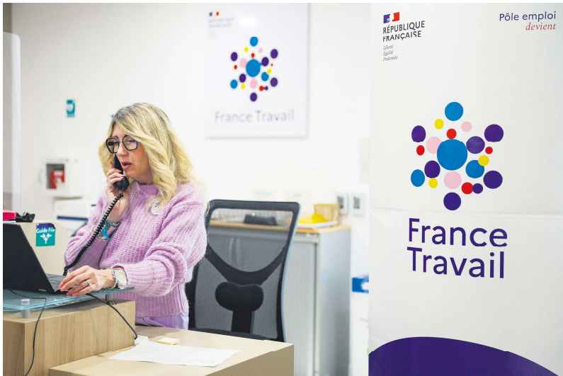
法国劳工局 (France Travail)

1月1日起，退休金将增加2.2%，也就是调整到要能跟得上通货膨胀的程度。如果前总理米歇尔·巴尼耶(Michel Barnier)的财经法案PLF被采纳，退休人员的养老金只增加0.8%，这对退休人员来说是一种缓