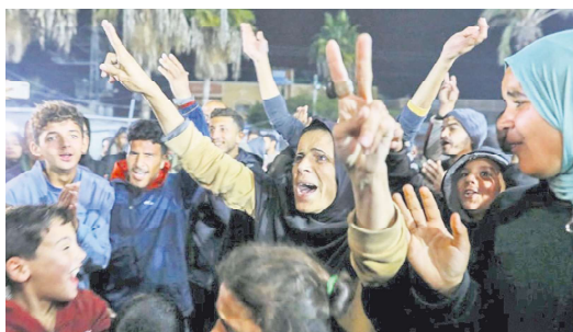
1月15日，随着以色列和哈马斯达成停火和释放人质协议的消息传开，加沙民众欢呼口号。

根据协议，在为期6周的第一阶段，将停止双方的敌对行动，以色列将释放737名巴勒斯坦囚犯，换取33名以色列人质获释。随后，双方将就第二阶段协议展开谈判，即释放所有剩余人质以换取永久停火。根据内塔尼亚胡的说法，第三是以色列将继续完全控制“费城走廊”（Philadelph