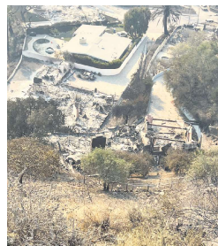
伍兹的房子在大火中幸存。

他回忆说，火灾发生时，周围房屋被火舌吞噬，场面如同地狱，他与妻子被迫紧急撤离。在面对可能失去家园的痛苦时，伍兹一度落泪。