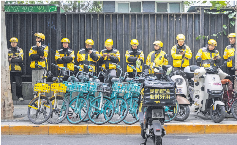
2024年10月30日,北京美团外卖员在上班前排队聆听主管指示。

过去30年中国经济的繁荣,让国际社会和中国人形成了一种认知,似乎这样的持续繁荣就是中国经济的本色。而笔者则以为,过去20年中国经济的繁荣主要由“出口景气”和“土木工程景气”构成,只有了解它们的由来,才可能理解,为什么今日中国的经济困境事出必然。