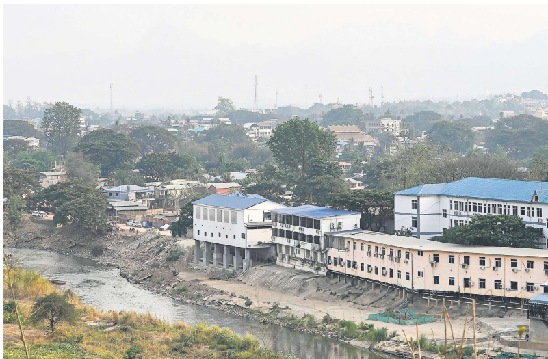
2024年4月11日，从泰国边境一侧看到的缅甸妙瓦底镇的全景。

截止BBC发稿，已有逾千位被绑至缅甸电信诈骗窝点的案例被上载，BBC记者浏览文档发现，这些失踪人员年龄以20岁至40岁为多，也有未成年和60多岁长者。据报导，泰国警方正在调查另一名华人模特儿在泰