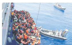
在地中海的救援任务

兰和立陶宛的路线，在去年非法入境数量却大幅增加，共有1万7001人次尝试，年增192%。