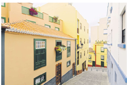
西班牙加那利群岛拉帕尔马岛首府

据西班牙国家统计局的住宅价格指数显示，2024年前九个月，房价平均上涨了9%。这一持续的增长标志着自2008-2009年金融危机导致银行和房地产崩溃以来的十年复苏。在经历了建筑过度开发和房地产投机