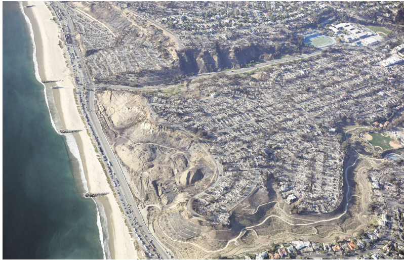
2025年1月13日，在加州“太平洋断崖”（Pacific Palisades），从空中俯瞰被山火摧毁的房屋。

影视剧演员萨拉·福斯特（Sara Foster）在社交媒体X上抨击说：“我们缴的税是加州最高的，但我们的消防栓空空无水……，水库被大坝排空——因为想要拯救鱼类；消防部门预算被市长削减，吸毒者得到了毒