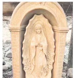
哈尔平家的圣母玛利亚像完好无损。

在这场灾难中，另一家庭也经历了奇迹——在大火吞噬一切的情况下，家中的圣母玛利亚和圣约瑟夫的雕像竟完好无损。