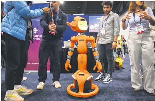
Enchanted Tools Mirokai机器人在2025年拉斯维加斯消费电子展(CES)上亮相。