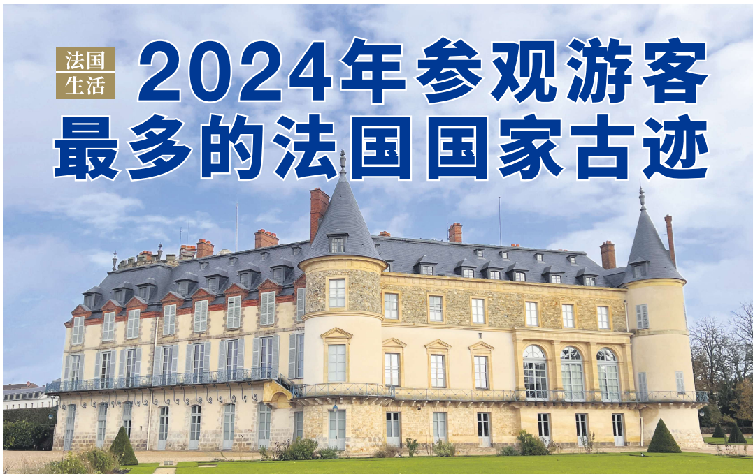
巴黎西南郊的朗布耶城堡(Château de Rambouillet)

2024年法国国家古迹中心的最吸引游客景点榜单的“前五名”和2023年的相同。紧随在凯旋门之后的榜眼景点,再次由圣米歇尔山修道院和参观了它的1百48万0031名游客摘得。排名探花的是位于巴黎塞纳河上西岱岛(又名城岛)的圣礼拜堂,参观人数为1百23万4676人次。紧随其后的是离圣礼拜堂不远的先贤祠,法国历代各界伟人的最终长眠之地备受瞩目,共接待了92万2426名访