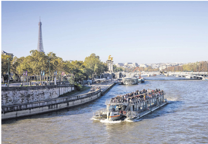
巴黎旅游办公室将采取人力服务与数码平台兼备的方式提供服务。

黎”（Paris Je T'aime）旅游服务将继续为游客提供人性化的服务。比如，巴黎将在报刊亭或邮局等地提供50余个信息点，游客可以在此提问或索取有关巴黎市的实用信息。而巴黎旅游局的数码平台将提供互动式地