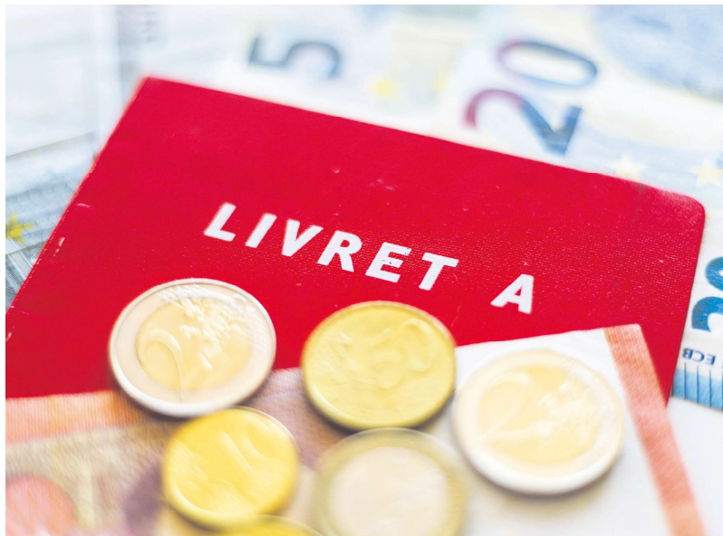
2月1日起，法国主要储蓄账户利率将下调。

法国储蓄账户的利率通常与通胀率挂钩，每年可能进行两次调整，分别在2月1日和8月1日生效。Insee最新发布的数据显示，法国2024年的通胀率相比前几年的高水平明显回落。政府也因此决定将A类储蓄账户和持续和团结发展账户的利率