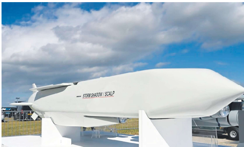
英国首相斯塔默承诺加大对乌克兰的安全保障力度。自2022年俄罗斯入侵以来，英国一直是乌克兰坚定的支持者。图为英国“暴风之影”导弹示意图。

协议提到，英乌拟合作打造灵活快速反应机制，包括建立并“共同运用”特别的军事编队或其它结