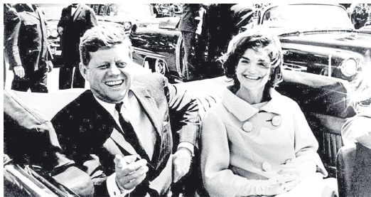
1961年6月3日，美国总统约翰·肯尼迪和妻子杰奎琳。