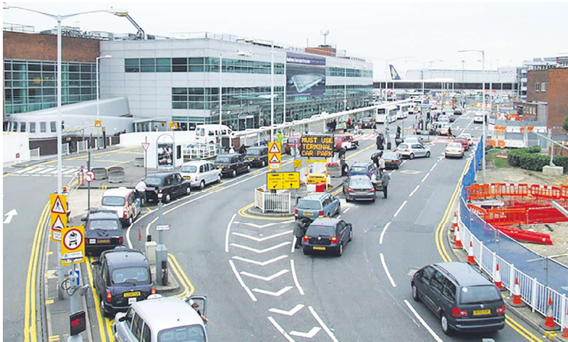
伦敦希斯罗机场21日因邻近变电站失火，一度全面关闭。图为机场二号航站楼。

希斯罗机场21日当天预计将起降1,351个航班，运送乘客291,000人。根据旅游数据公司OAG，该机场去年是全球第二繁忙的国际机场，仅次于迪拜，去年的客流量达到8390万人次。此次关闭预计将在全球范围内产生持续数天的连锁反应，