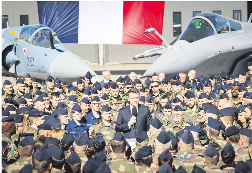
2025年3月18日，法国总统马克龙（中）在访问法国东北部吕克瑟伊-圣索沃尔空军基地时，在幻影2000战斗机（左）和阵风战斗机（右）前发表演讲。

地进行全面现代化改造，包括重建跑道、建设新型维护机库、升级核指挥系统及加强基地安全设施。这一系列投资不仅涉及军事基础设施，也将