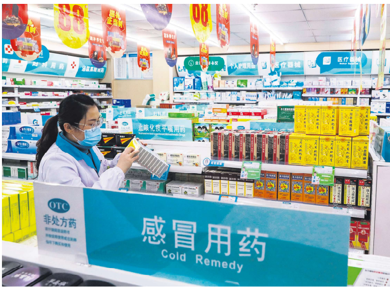
2022年12月10日江苏省一家药店

据自由亚洲电台报导分析，中国药店倒闭的主要原因之一是医保政策的收紧。过去，医保支付一直是药店收入的重要来源。但近年来，政府对药店的医保资格监管力度不断加大，尤其是对“骗保”行为的严查，导致一些药店失去了医保支付资格。一名前药店老板指出，医保政策影响药店的盈利能力。药店一般分为两种：连锁店和个体店。那些跟药