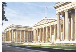
大英博物馆入口。

而温莎大公园(皇家地产的一部分)是游客最多的户外景点，去年共接待了5,670,430名游客，增长3%，位居第三。