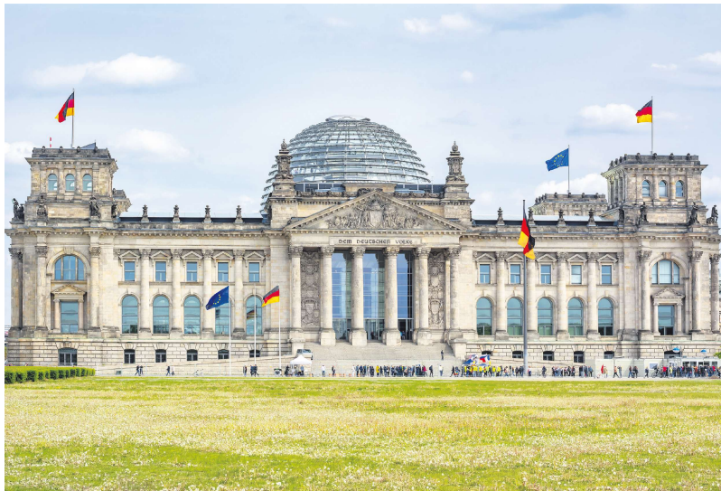
柏林德国联邦议会大厦

此外，还将设立一个5000亿欧元不受债务刹车限制的专项基金，将提供给联邦政府用于修复国内破旧的设施。联盟党和社民党为了得到绿党议员的赞成票，不得不妥协承诺将其1000亿欧元投资于气候保护和气候友好型经济结构调整，并致力于在2045年实现气候中和。另外1000亿欧元将流向各州政府。这也