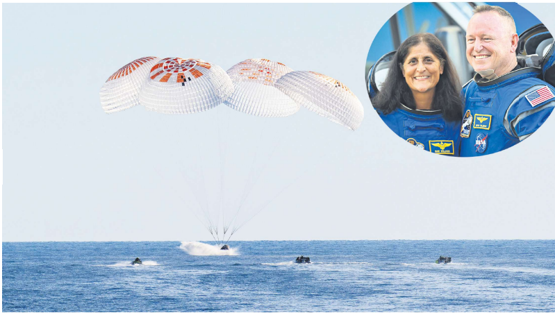
3月18日，载有NASA宇航员威尔莫尔（小图/右）和威廉姆斯（小图/左）的SpaceX龙飞船在佛州海域成功着陆。

SpaceX首席执行官埃隆·马斯克（Elon Musk）在3月18日接受《福克斯新闻》采访时，对NASA的合作以及川普总统的推动表示感激。他透露，此前曾提议提前接回滞留的宇航员，但被搁置。