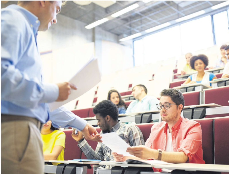
法国只有36%的大学生能在三年内获得本科学位。

根据审计法院调查，在上马恩省(Haute-Marne)、默兹省(Meuse)、孚日省(Vosges)和上索恩省(Haute-Saône)这四个省份的农村地区，2020年只有20%的人口