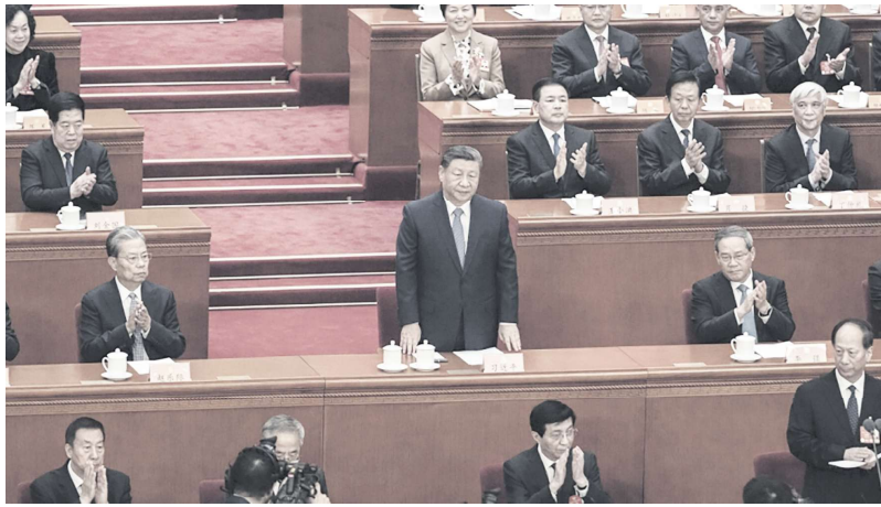
党内高层出席政协会议

关的不同形式的贿赂或贪污。公开资料显示，一些官员及其家人因其职位和关系积累了大量财富。