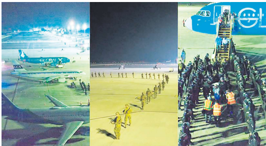
3月16日，美国遣送238名囚犯至萨尔瓦多。（视频截图）

根据协议，美国每年支付给萨尔瓦多600万美元，用于安置这些囚犯。对于美国来说，这笔费用能减轻