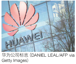
华为公司标志。

根据比利时法语区主要报纸《晚报》和其它媒体的调查，为中国电信巨头华为工作的游说人员涉嫌