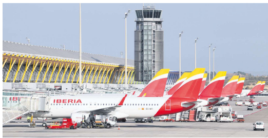
伊比利亚航空的飞机停在马德里机场。

在新闻发布会上，甘达拉还谈及了西班牙航空业面临的一些挑战。他特别强调了一个重要问题：政府拖