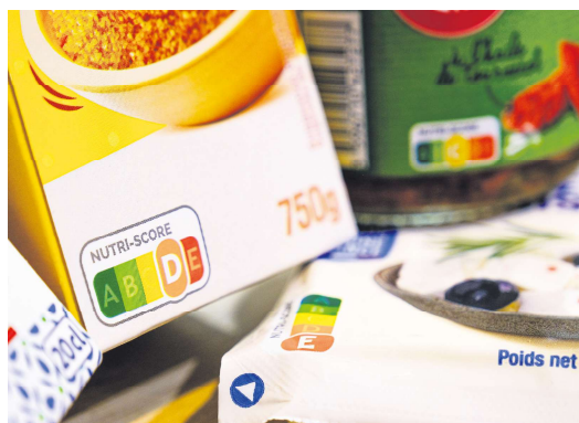
食品营养指数标识(Nutri-Score)