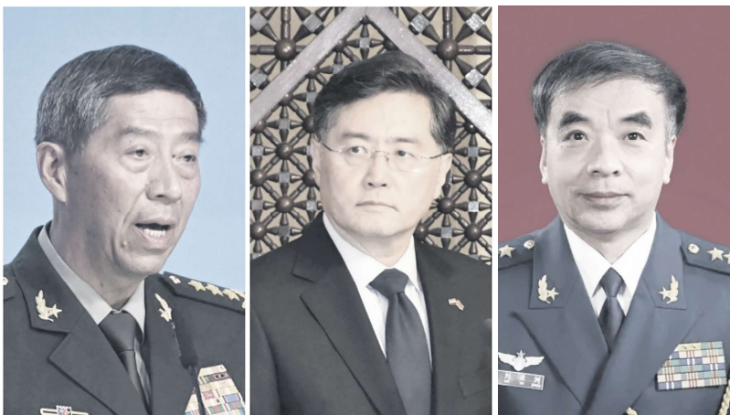
前国防部长李尚福(左)、前外交部长秦刚(中)和退役上将刘亚洲(右)

布了中央军委委员、军委政治工作部上将军苗华，涉嫌严重违法违纪被查的消息。至今，苗华也处于“被失踪”状态。